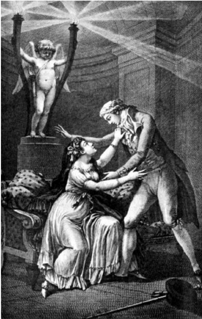
Par Charles Monnet — Liaisons Dangereuse, Lettre X.

de la lettre de la Marquise de Merteuil au Vicomte de Valmont, où elle décrit ses folies avec un chevalier. — Je ne vous mets ici qu'un passage, mais si le cœur vous en dit, vous pouvez allégrement aller vérifier ma source que je dépose ici —